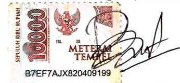
Floriberta Dewi Ambarwati